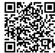
倫理ホットライン QRコード

正当な理由から本規範の違反に該当すると確信できる非倫理的行為や違法行為を認識した場合は、その旨を報告する義務が私たち全員にあります。積極的に 助言を求める こと、そして時機を逃すことなく正確かつ誠実に状況を説明する姿勢が何よりも大切です。トムソン・ロイターはオープンなコミュニケーションを尊重します。